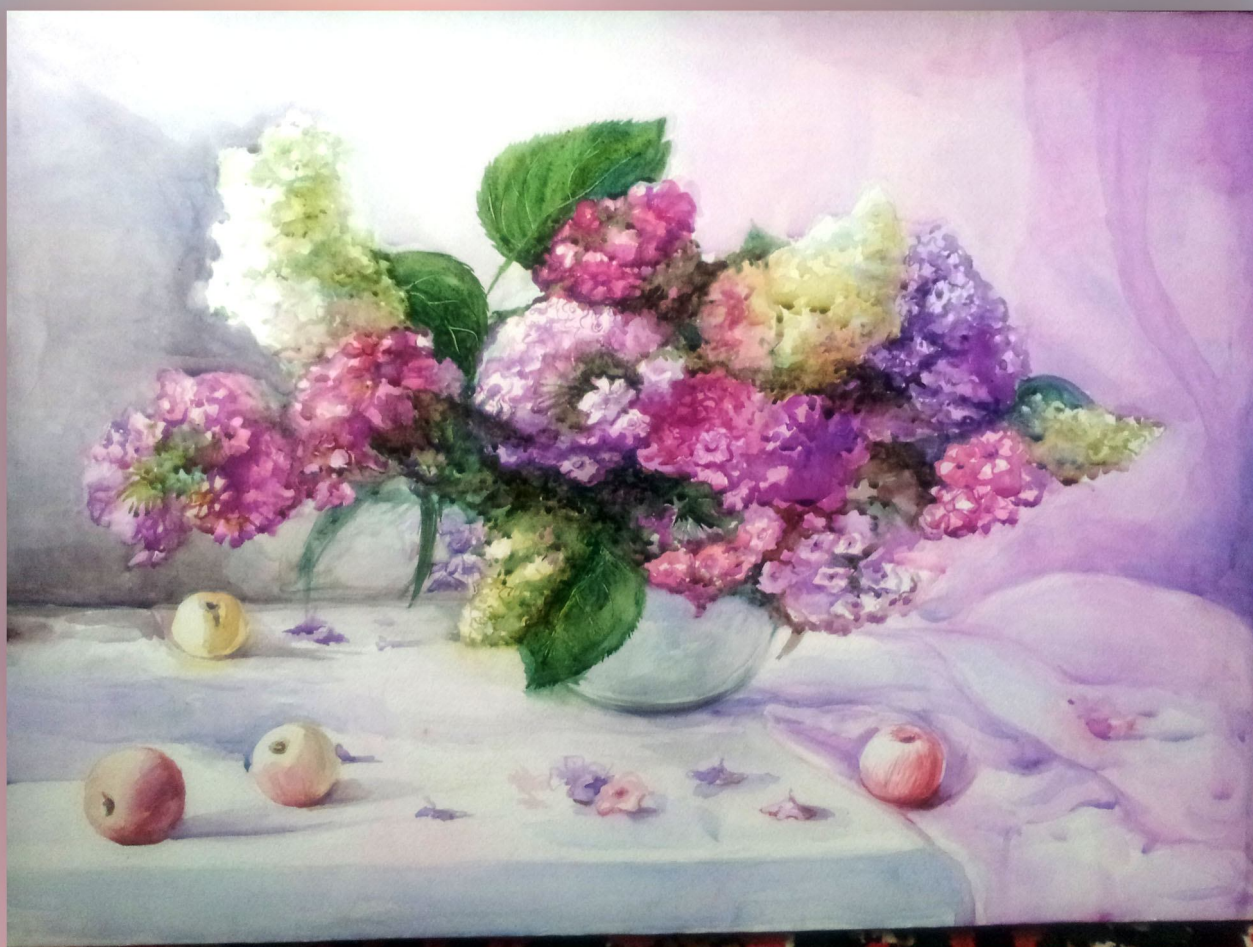
Ҷиллоӣ ХУДОИНАЗАРОВА иҷодидан